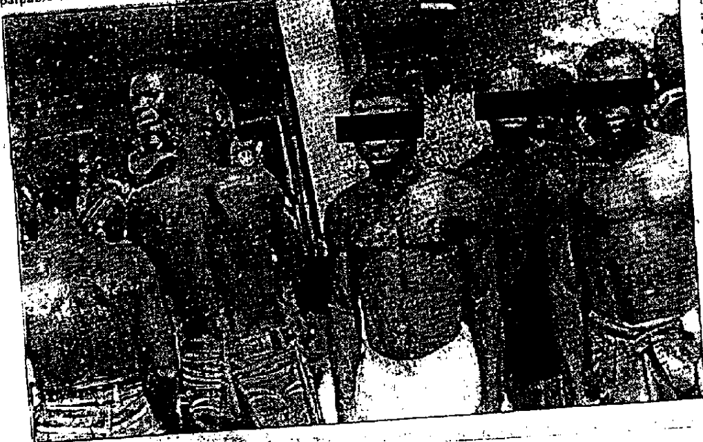
Nabbed suspected cultists

Contacted for comment the Police Image Maker Edo State Public Command ASP Pete Oghoi debunked the allegation, stating that it was the duty of the police to arrest and investigate suspected criminals among members of the society as any person who gives money to the police to secure suspects had was not helping matters.