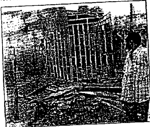
Wreckage of the burnt building

It would be recalled that last year a 14-month-old baby was reportedly roasted in a fire outbreak that engulfed a building in Okada junction following the sale of petrol inside the building.